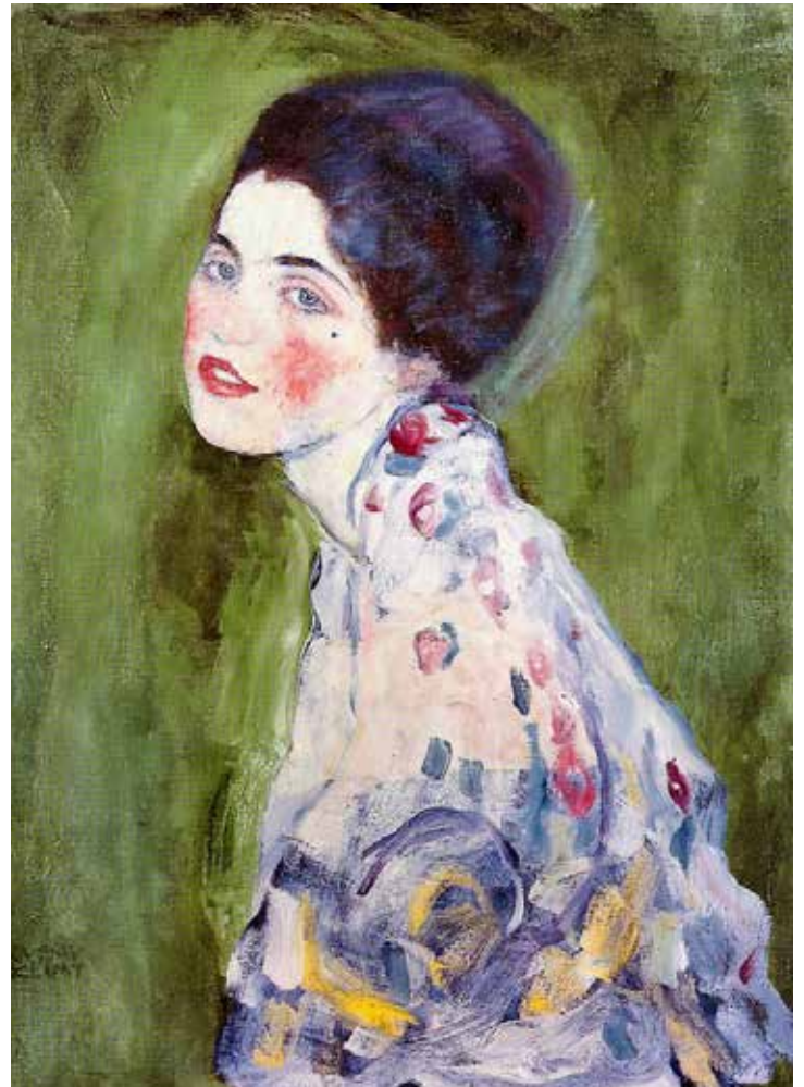
Gustav Klimt, Portret van een dame . Links de eerste versie, rechts de tweede